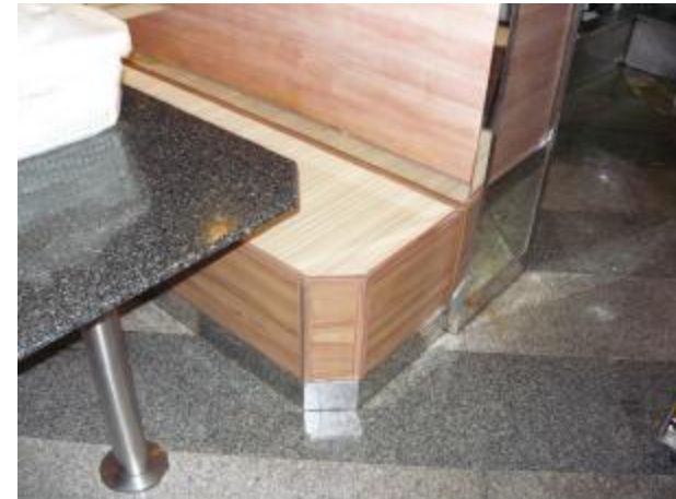
Inside the crack of the chair is also the place for cockroach hiding