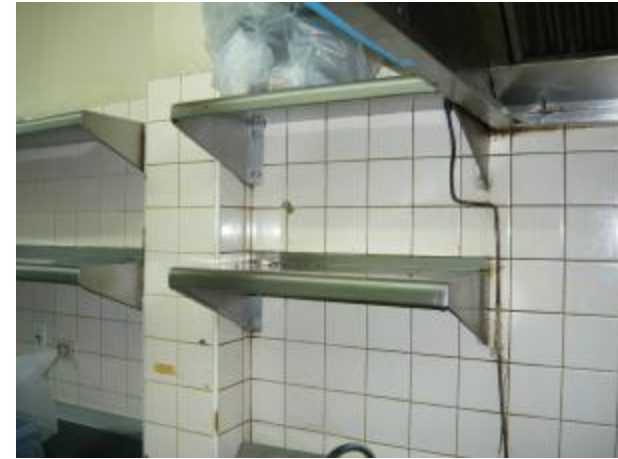
Under the drawer is the place where cockroach hide