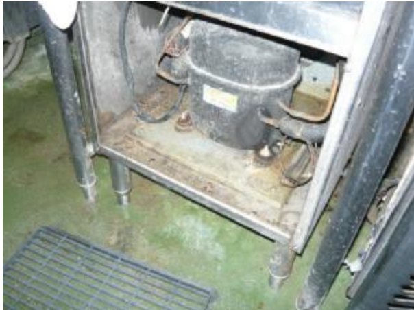
Inside the refrigerator near compressor , many cockroach hide as there are water