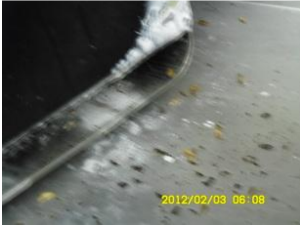
cockroach after spraying chemical