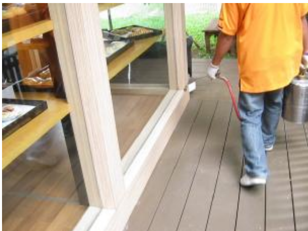
We use pressure spray chemical around the restaurant area