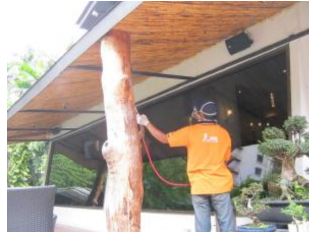
We use pressure spray chemical around the restaurant area