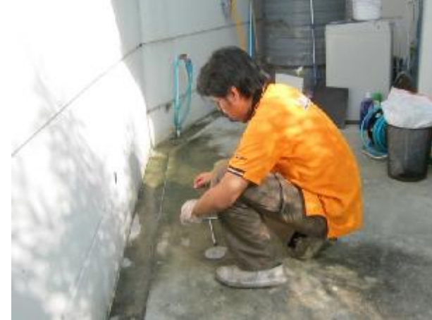
Inspection station every months