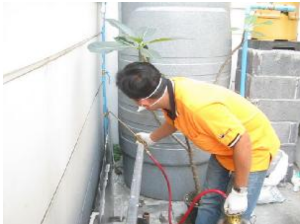
In case we found ant or cockroach , we will use chemical to terminate