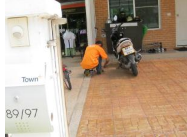
Process that we inspect cement station to check termite attack