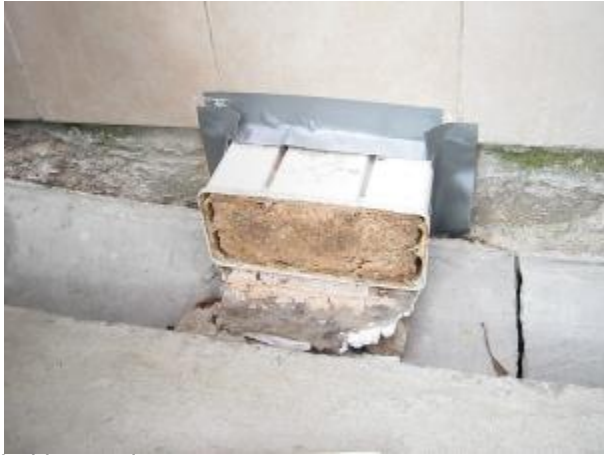
On Ground baiting station