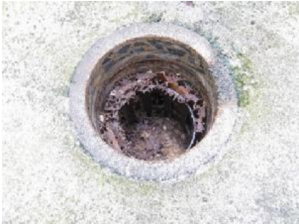
Cement station after termite eating bait