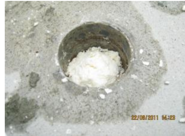
We add requim termite bait at cement station that found termite