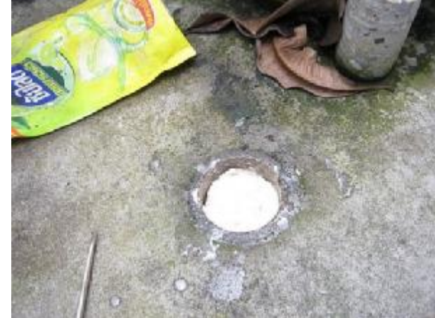
We add the termite bait for termite