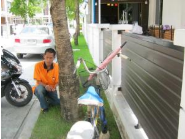
around tree there are termites