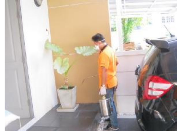
In case we found ant or cockroach , we will use chemical to terminate