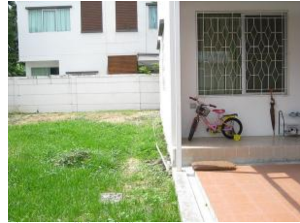
in Land station , we will install distance 4 meter