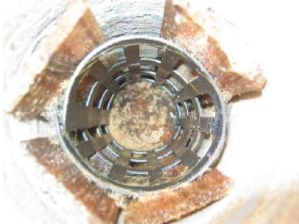
In case there are mold on the wood , we have to replace new wood