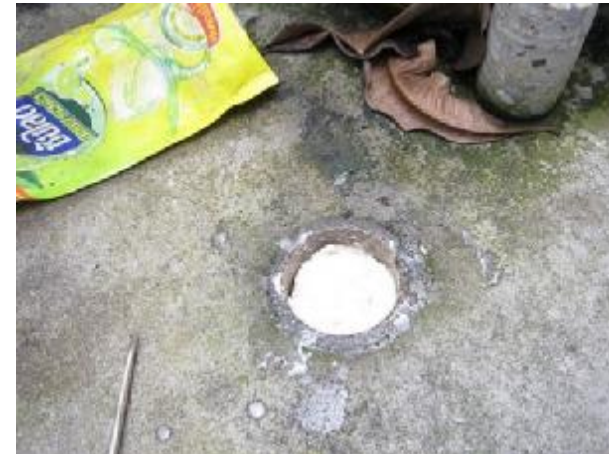
จึงต้องเติมรีเตรียมไว้เพื่อกำจัดปลวก