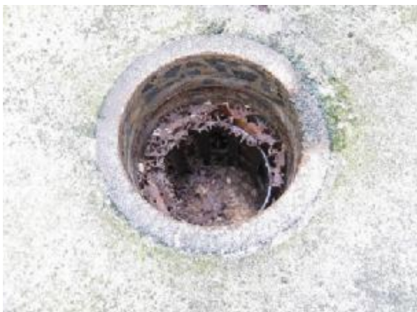
สถานีฝังปูนที่ปลวกเข้ากินเหยื่อ