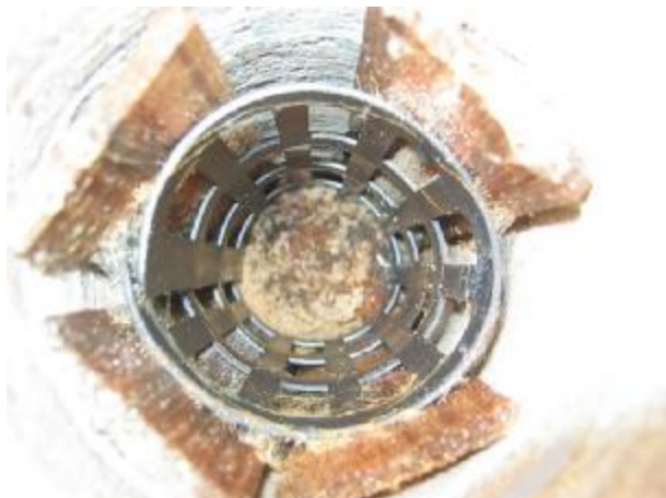
ในกรณีที่ไม่สำหรับสอปลอกขึ้นเราก็จะทำการเปลี่ยนไม่ใหม่