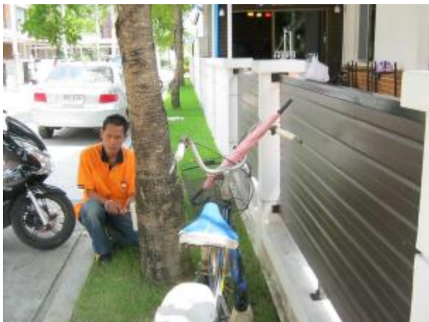
บริเวณต้นไม้ที่มีปลวกขึ้นอยู่