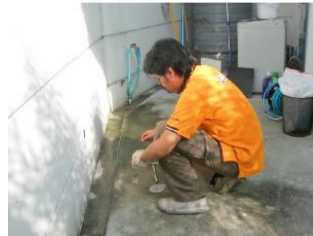
การตรวจสอบสถานะตามจุดต่างๆ