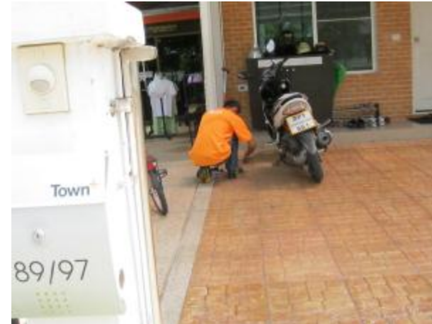
การตรวจสอบสถานีฝังปูนตามพื้นที่ที่อยู่ในความดูแล