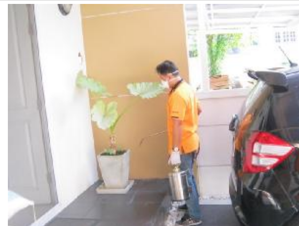
มีบริการพ่นยากำจัดแมลง มด ด้วย