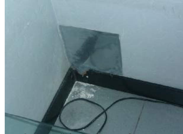
ภาพตัวอย่างการปิดกั้นช่องทางหนูไม่ให้เข้ามาบริเวณลูกค้าในสถานที่ทำงาน