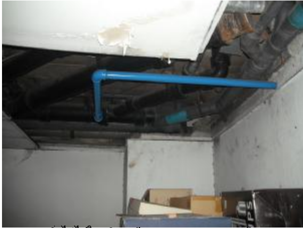
แนวท่อต่างๆที่เห็นสามารถวิ่งได้ไปในบริเวณฝ้า เพดานของอาคารลูกค้า