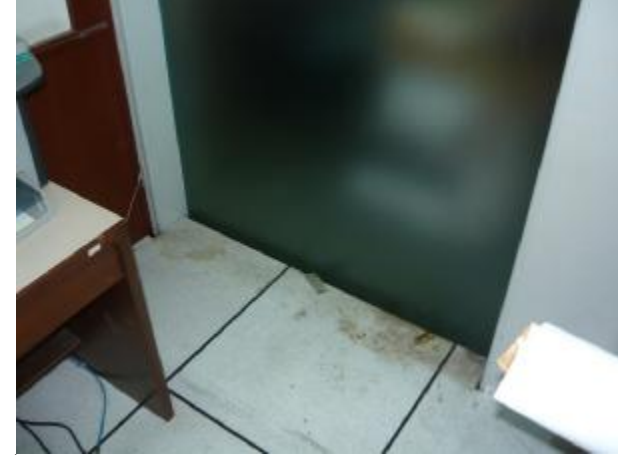
บริเวณที่พบร่องรอยของหนู