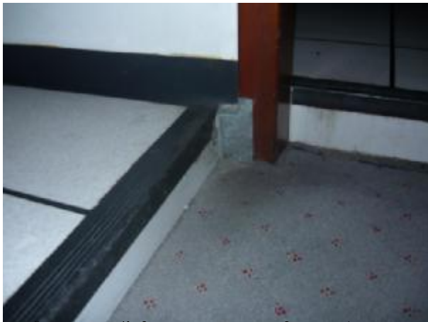
ภาพตัวอย่างการปิดกั้นช่องทางหนูไม่ให้เข้ามาบริเวณลูกค้าในสถานที่ทำงาน